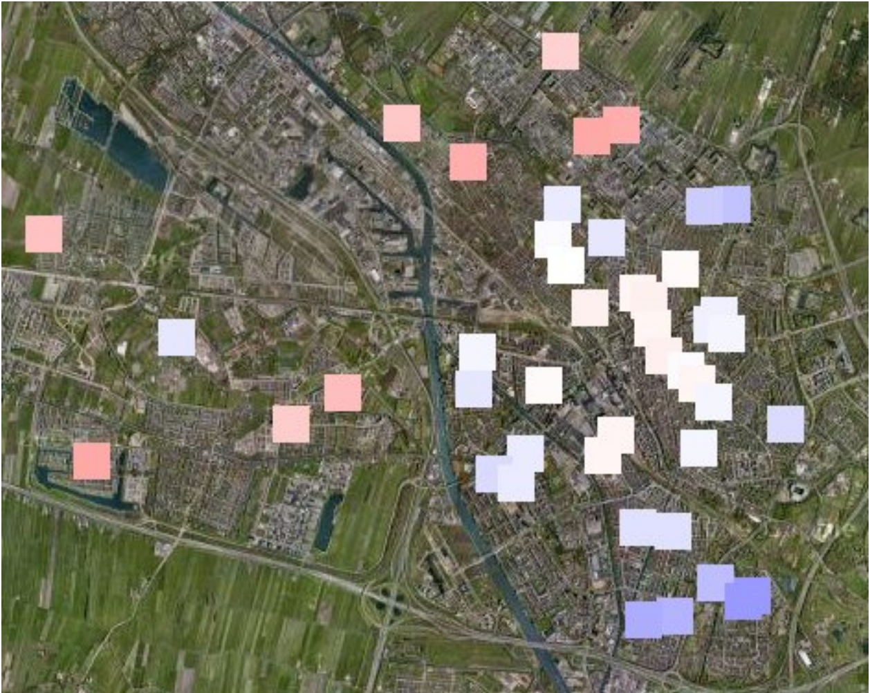
Afbeelding 1. Percentuele verschillen tussen OV-chipkaart en strippenkaart (SP-voorstel)