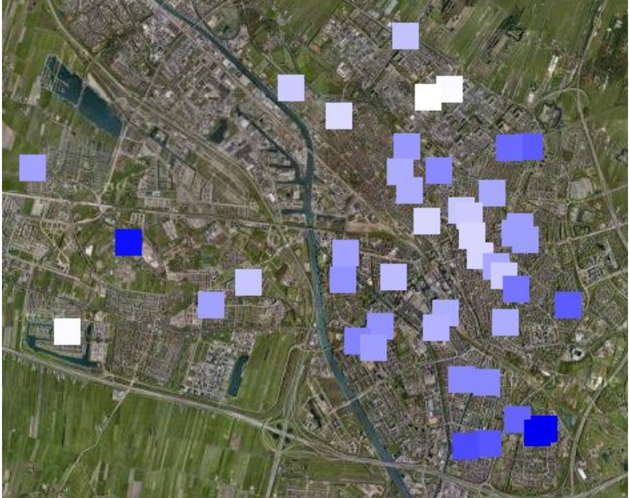
Afbeelding 1. Percentuele verschillen tussen OV-chipkaart en strippenkaart in de stad.

Omdat de stad verdeeld is in verschillende zones en de kosten voor de OV-chipkaart wordt berekend naar afgelegde afstand zijn er verschillen in de stad te verwachten. In de onderstaande afbeelding is het verschil in prijs tussen de OV-chipkaart en de strippenkaart over heel Utrecht weergegeven.